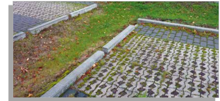
Verwendung von Rasengittersteinen

Wenn Sie öffentliche Parkplätze für das Gewerbegebiet planen, können Sie mit einer wasserdurchlässigen Bauweise – etwa mit Rasengittersteinen oder dem Einbau von Mulden als Versickerungsmöglichkeiten – eine Flächenversiegelung reduzieren. Dies senkt zudem die Abwassergebühr. Gleichzeitig können Sie mit einer vegetationsfähigen Umsäumung der Parkplätze, welche sowohl eine spontane Entwicklung der Krautvegetation als auch das Wachstum von Gehölzen zulässt, wertvolle Kleinst- und Trittsteinbiotope schaffen.