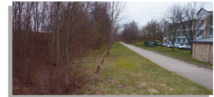
Graben mit Gehölzstruktur

Über einen wachsenden Flächenbedarf der künftigen Gewerbetreibenden lässt sich in der Regel zum Erschließungszeitpunkt keine Prognose treffen. Um künftige Nutzungskonflikte zu umgehen, sollten Sie bereits bei der Erstplanung über mögliche Erweiterungsräume nachdenken und für optionale Erweiterungen die unmittelbare Nachbarschaft zu wertvollen Naturschutzgebieten vermeiden.