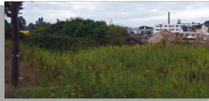
Extensiv gepflegte Lärmschutzaufschüttung