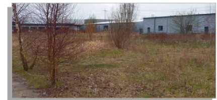
Freie Brachenentwicklung innerhalb eines Gewerbegebietes