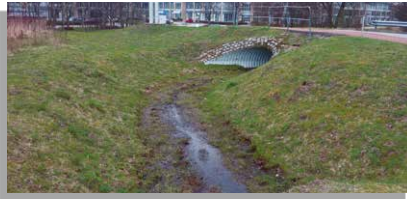
Nicht genutzte Fläche im Gewerbegebiet

Beim effizienten, geradlinigen Zuschnitt eines Gewerbegebiets und seiner Parzellen kommen Ihnen unter Umständen Hindernisse wie Abhänge, Findlinge oder Feuchtgebiete in die Quere. Auch durch Abgrenzungen zum Nachbargrundstück können kleinteilige Flächen entstehen, die in der Regel nicht genutzt werden. Hier können sich kleine, wertvolle Biotope bilden. Die Kosten solcher nicht