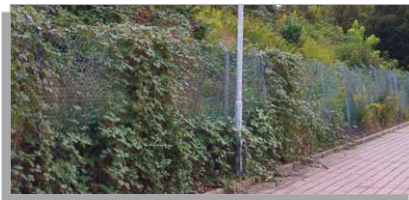
Extensiv gepflegte Lärmschutzaufschüttung

Mit extensiv gepflegten Straßenböschungen oder begrünten Lärm- und Sichtschutzmauern können Sie wertvollen Nahrungs- und Lebensraum schaffen. Solche Mauern unterscheiden sich nach dem Fassadentyp, der Größe der Fassadenbegrünung und der Begrünungsart, etwa durch selbstkletternde Pflanzen oder Pflanzen, die eine Rankhilfe benötigen.