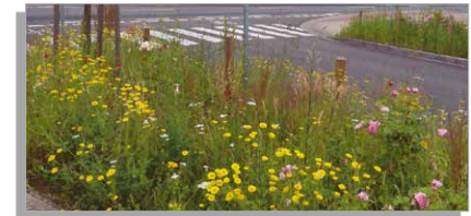
Straßenrandstreifen mit Wildblumen

Nur in seltenen Fällen können unmittelbar nach der Erschließung eines Gewerbegebiets alle Flächen verkauft werden. Im Gegenteil: Es kann Jahre dauern, bis alle Flächen eines erschlossenen Gewerbegebiets veräußert sind. Diese ungenutzten Flächen können Sie der Natur „leihen“. Wenn Sie diese zum Teil größeren Flächen äußerst extensiv pflegen oder ihnen gar eine freie Entwicklung zugestehen, können sich hier viele Arten vorübergehend ansiedeln.